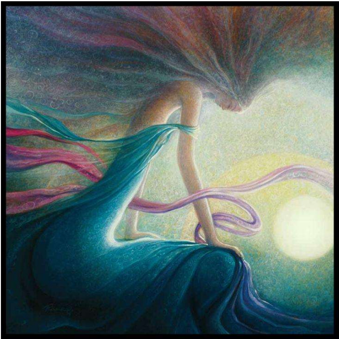
schilderij door Freydoon Rassouli