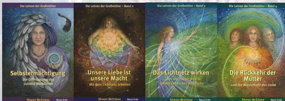
Die 4 Grossmütter-Bücher